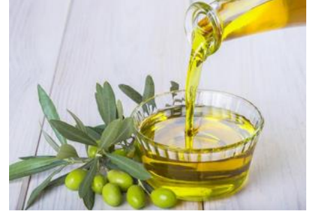
Aydın Memecik Zeytinyağı (2020)