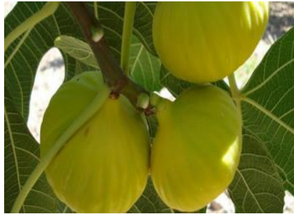
Aydın Fig (2007)