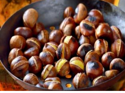
Aydın Kestanesi (2010)