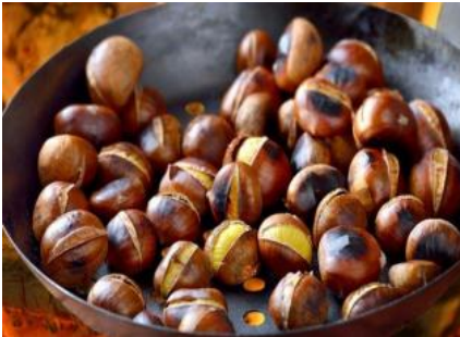
Aydın Chestnut (2010)