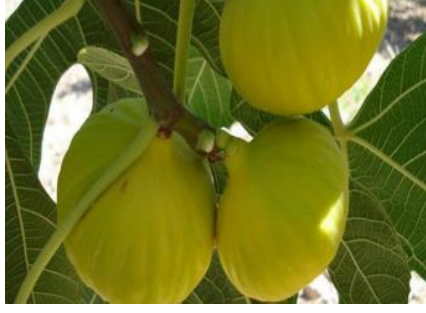
Aydın İnciri (2007)